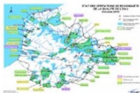
Carte : les opérations de reconquête de la qualité de l'eau (ORQUE) en octobre 2015