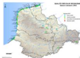
Carte : qualité des eaux de baignades – saison balnéaire 2012