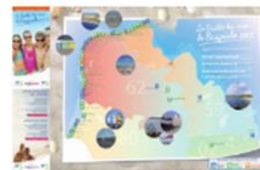
Carte : qualité des eaux de baignades – saison balnéaire 2013